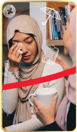
Kematian dan Kehilangan Upaya