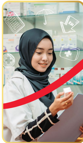
Perubatan dan Hospitalisasi