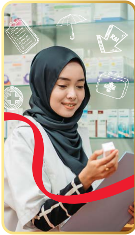
Perubatan dan Hospitalisasi