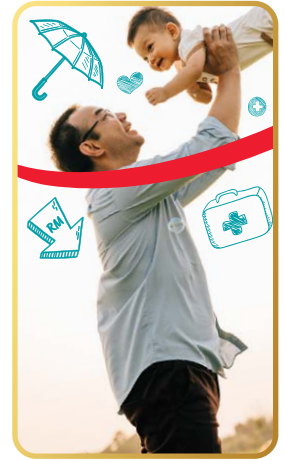
Dan banyak lagi!